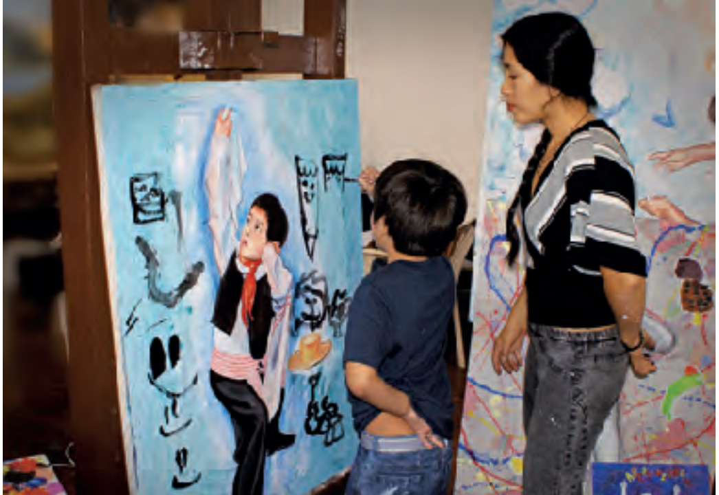
Óleo sobre lienzo con intervención en acrílico.