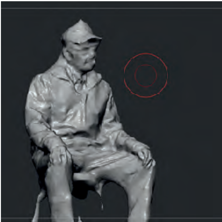
Escultura digital desde fotogrametría. Corte laser y aplicaciones sonoras.