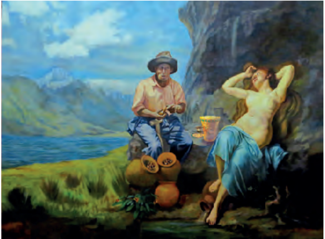
Óleo sobre lienzo con intervención en acrílico.