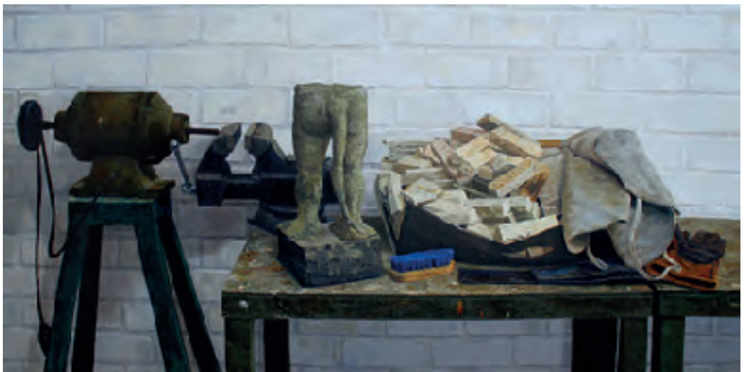
Óleo sobre lienzo.