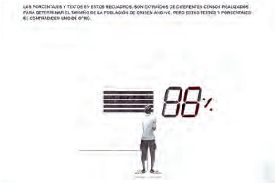
Instalación con video, fotografía, arte electrónico, documentación.