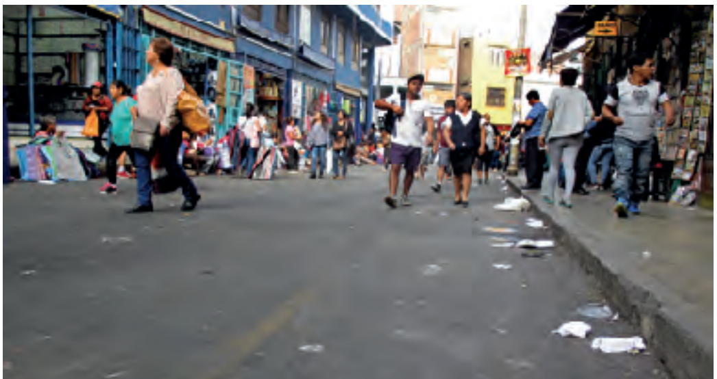
Escultura en plásticos