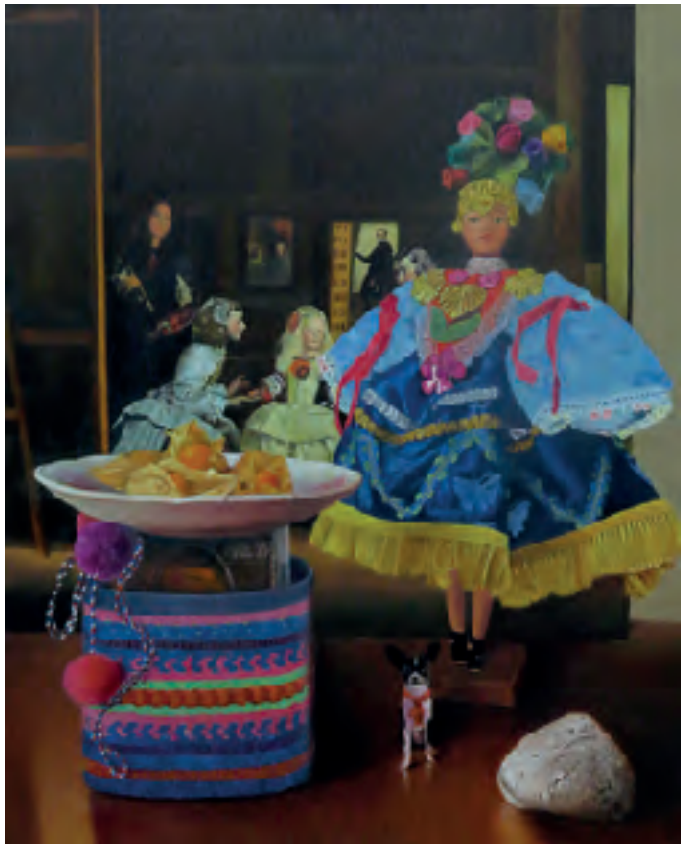
Óleo sobre lienzo.

“A medida que vamos creciendo empleamos menos tiempo en fantasear dejando esas creencias e imaginación atrás. Quiero volver a sentir lo que sentía cuando pequeña, quiero volver a mi pasado”.